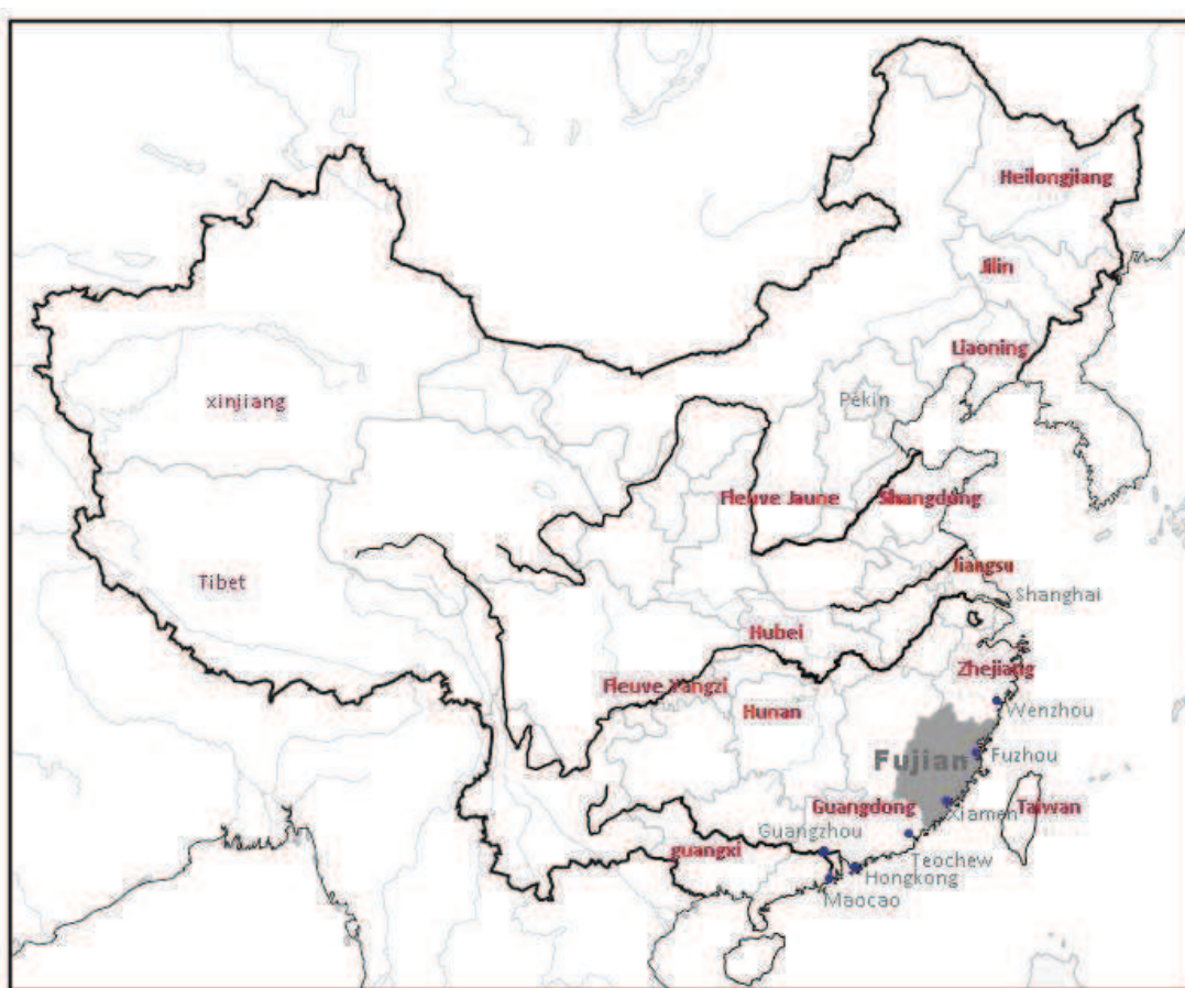
C 1-1 La carte de la Chine

Les provinces mentionnées se trouvent sur la carte de la Chine ci-dessous.