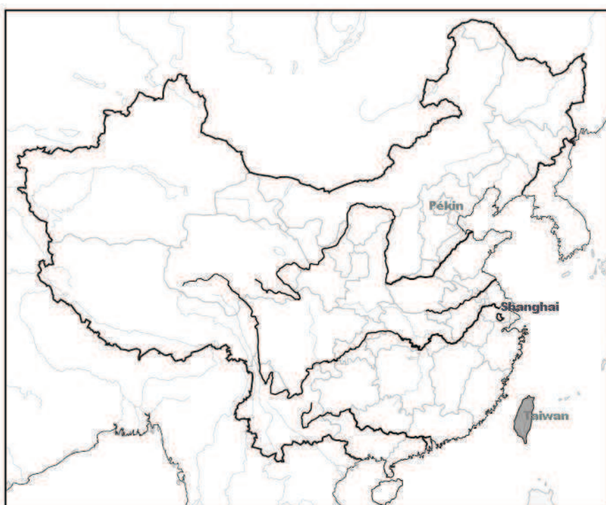
CA-5 L'île de Taiwan

Ce furent seulement des populations austronésiennes qui l'occupèrent jusqu'à l'époque de l'expansion économique maritime des Song du Sud (1127-1279). Depuis, les Han s'y sont installés pour cultiver des champs. En 1171, l'empereur Xiaozong (孝宗, 1127-1194) installa une garnison dans l'archipel Penghu (澎湖列島, les Pescadores en portugais) qui relève du district Jinjiang au Min du sud. Après sept navigations glorifiées entre 1405 et 1433, les Ming (1368-1644) décrétèrent l'embargo en 1563, puis le règne des Ming sur l'archipel fut démantelé par la Compagnie néerlandaise des Indes orientales en 1622. Deux ans après, les armées des Ming reprirent l'archipel et la Compagnie néerlandaise recula dans l'île de Taiwan où il n'y avait pas encore de gouvernement au sens strict. À partir de cette époque, les Hollandais encouragèrent la migration chinoise dans le but de développer l'agriculture. Après presque vingt ans de résistance infructueuse contre les Mandchous, Zheng Cheng-Gong (鄭成功, Koxinga, 1624-1662), conquiert Taiwan en 1662 et exerça une première gouvernance des Han sur l'île. Il mourut peu après. Après trois générations