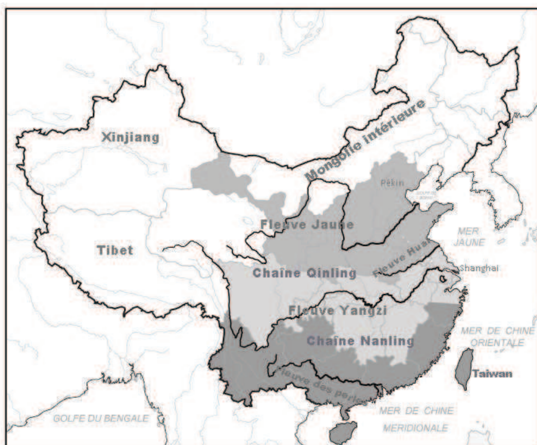
C 1-2 Les trois zones géoculturelles 5

Dans l'histoire, la Chine a connu cinq grandes migrations des «汉 Han» du nord au sud qui furent toutes causées par l'incursion des nomades. La principale raison de l'incursion réside dans la quête du pouvoir, de la richesse et du territoire. Entre les pâturages des tribus nomades et les champs des «汉 Han», il n'existe pas d'écran